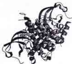
Ret-protooncogen : mengkode reseptor tirosin kinase

pada awal terjadinya karsinoma papiler tiroid didapatkan perubahan pada RET proto-onkogen. Penemuan adanya RET proto-onkogen memiliki dampak klinis dalam hal skrining dan pengobatan profilaktik pada pasien dengan kecurigaan karsinoma tiroid familial.