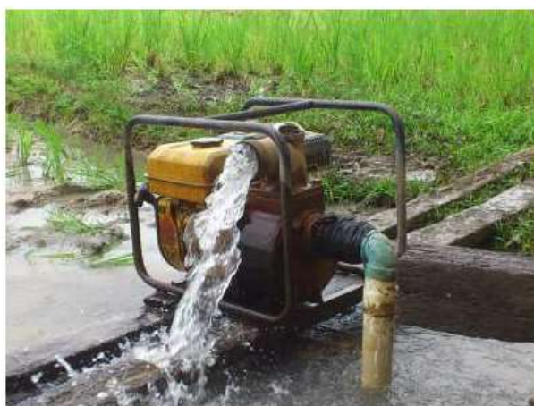
Gambar 1. Hasil Pembangunan Instalasi Pompa Irigasi

Instalasi pompa irigasi dibangun langsung di area persawahan yang akan diairi, pembangunan instalasi pompa irigasi ini diawali dengan proses pengeboran tanah untuk mendapatkan sumber air tanah. Mata bor yang digunakan berukuran 4 inchi. Pada tahap pembangunan instalasi pompa irigasi ini didapatkan lapisan air tanah pada kedalaman 18 meter di bawah permukaan tanah. Pipa yang digunakan untuk menghisap air berdiameter 3 inchi yang disambungkan dengan mesin pompa berdaya 4.2 kW. Hasil pembangunan instalasi pompa irigasi dapat dilihat pada Gambar 1.