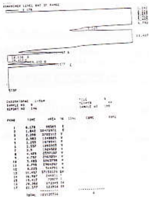
Gambar 3 : Khromatogram dari sampel abu kocok 500 ml