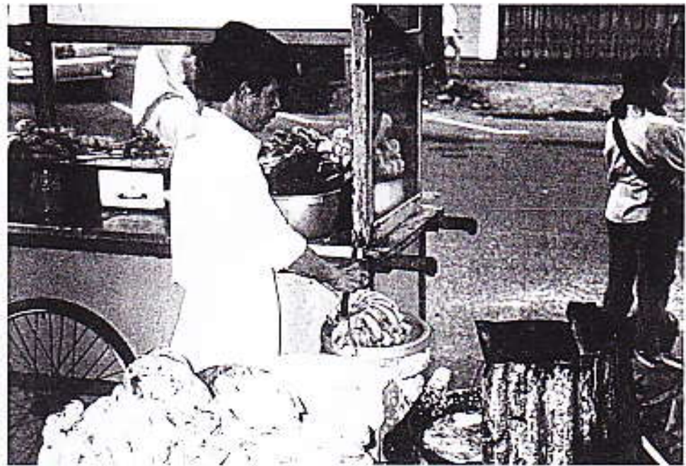
Foto 9 : Pedagang pisang goreng sedang mempersiapkan dagangannya.