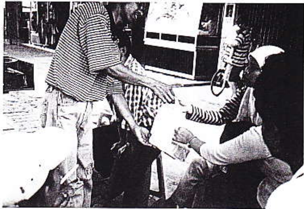
Foto 12 : Penjual martabak Bandung memberikan martabak pada pembeli.