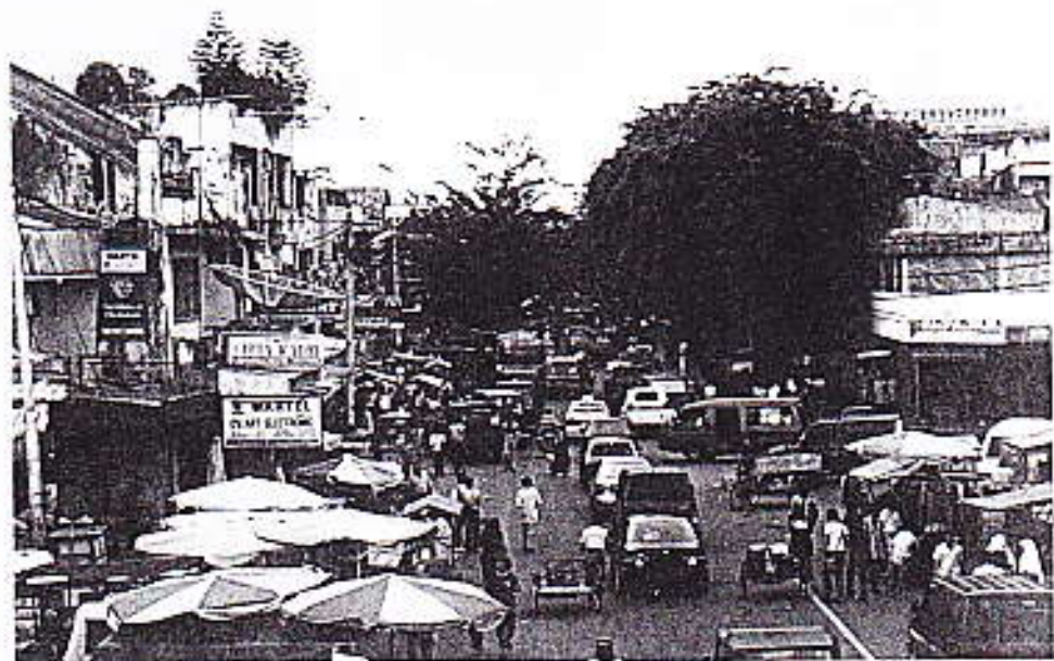
Foto 1 : Kesibukan di jalan Permindo dilihat dari arah Pasar Raya

Secara umum laju pertumbuhan penduduk kota Padang periode 1990-2000 sebesar 1,20%. Kalau dilihat dalam konteks wilayah kecamatan maka kecamatan kurangi yang memiliki laju pertumbuhan penduduk yang cukup besar yakni 4,41%. Hal ini disebabkan karena kecamatan ini dijadikan salah satu wilayah pengembangan penduduk, dengan didirikannya berbagai kompleks pemukiman.