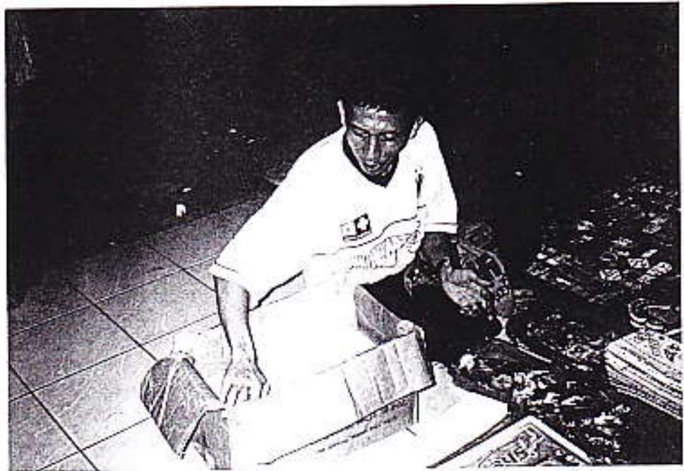
Foto 14 : Sehabis magrib seorang pedagang aksesoris mulai menyimpan barang jualannya ke dalam kotak kardus

yang tutup pukul 23.00 malam ini tempat menyimpan barangnya di rumah mereka masing-masing yang kebetulan dekat dengan Permindo.