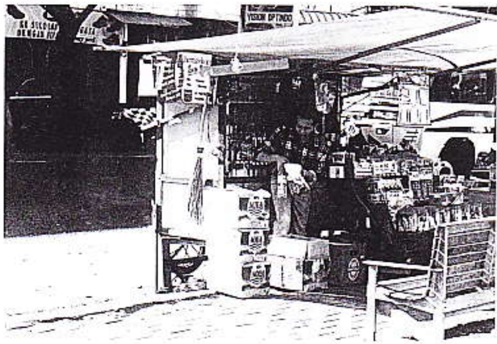
Foto 8 : Pemilik kios rokok menyusun barang dagangannya sambil menunggu pembeli

Untuk melengkapi barang dagangannya pedagang kaki lima biasanya belanja di tempat-tempat tertentu. Ada yang belanja harian ada juga yang tergantung stock barang dagangan. Penjual makanan dan rokok biasanya belanja barang dagangannya tiap hari, sementara pedagang lain tergantung keadaan bisa sekali seminggu atau sekali sebulan. Untuk pedagang belanja harian biasanya dilakukan pada pagi hari. Ada yang sebelum dia membuka dagangan pagi-pagi sekali, ada yang setelah buka dagangan karena teman yang menjaga saat dia berbelanja.