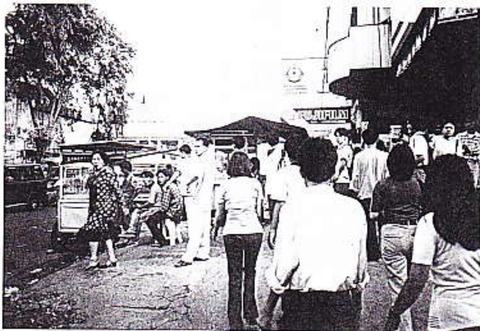
Foto 3: Kesibukan di salah satu sisi jalan Permindo tampak pedagang kaki lima, pejalan kaki, orang sedang menunggu bus.

Terdapat sekitar 30 pedagang kaki lima di sepanjang jalan Permindo, mereka menggelar dagangan di emperan toko , di trotoar, dan bahkan ada yang mengambil sebagian jalan untuk berjualan. kalau dikelompokkan mereka bisa dikelompokkan ke dalam 4 jenis besar apa yang diperdagangkan yang pertama adalah penjual makanan atau minuman, penjual koran, penjual rokok, penjual aksesoris, dan penjual vcd