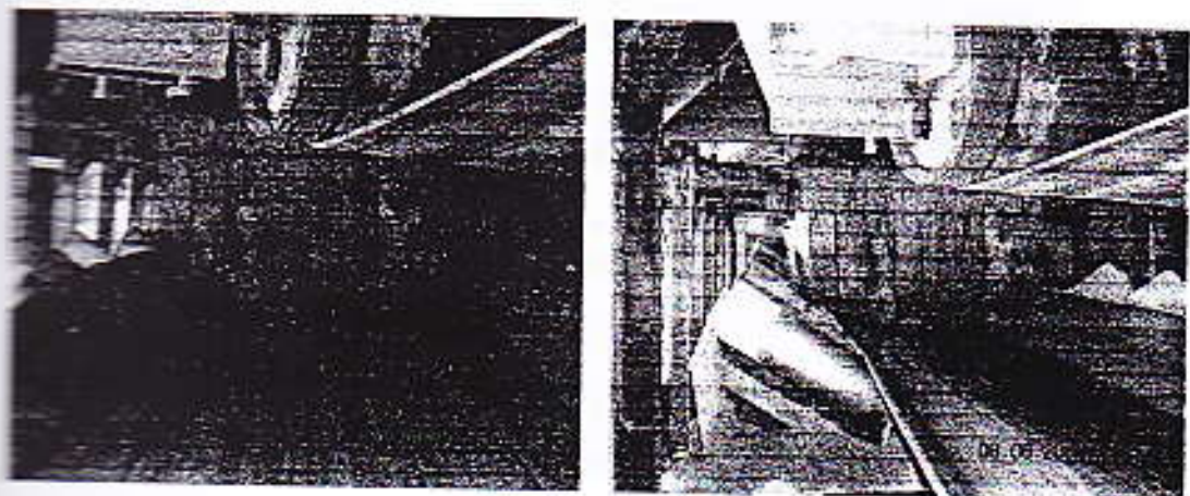
Gambar 1.2 Kondisi belt dengan lebar yang standar (kiri) dan kondisi belt yang lebarnya sudah berkurang (kanan)

Berkurangnya lebar belt conveyor diakibatkan kondisi belt pada saat operasi miring ( sway ). Hal ini bisa mengakibatkan kapasitas pengiriman menjadi turun.